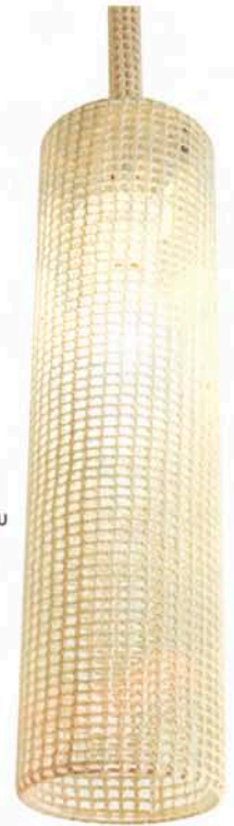
Villalangasta virkattu Glow-valaisin.